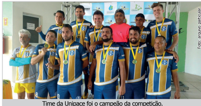
Time da Unipace foi o campeão da competição.

Quatro equipes participaram do evento, que teve três partidas. No terceiro jogo, que foi decisivo, a Unipace marcou 2 gols contra a Certa Serviços Empresariais e Representações, empresa tercerizada pela Assembleia Legislativa.