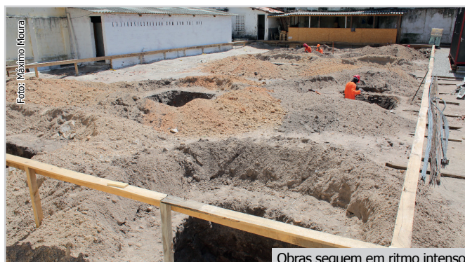
Obras seguem em ritmo intenso