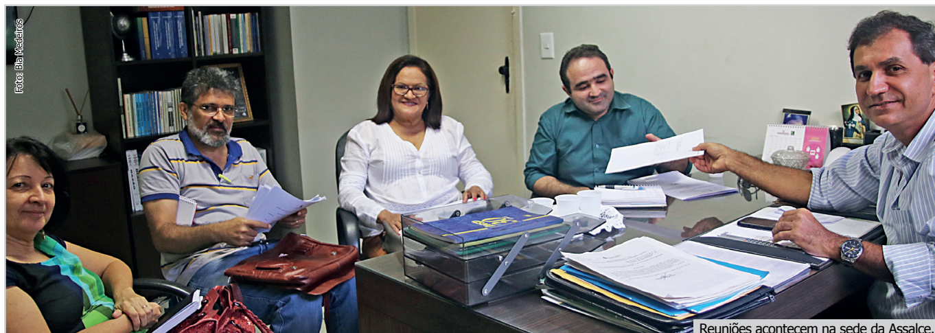
Reuniões acontecem na sede da Assalce.