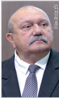
Fernando Hugo, Deputado Estadual da Assembleia Legislativa do Estado do Ceará

Parabéns, Assalce! A vocês, nosso apoio e nossa voz pelo bem do funcionalismo público no Legislativo do Ceará!