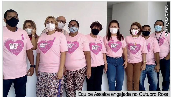
Equipe Assalce engajada no Outubro Rosa

A instituição é uma casa de apoio ligada ao Instituto do Câncer do Ceará (ICC), que acolhe pacientes do interior do estado que estão em tratamento contra o câncer. O novembro azul também marcou o calendário de eventos da entidade. A Assalce realizou a campanha de prevenção do câncer de próstata, com exames de PSA e atendimento de médico urologista.