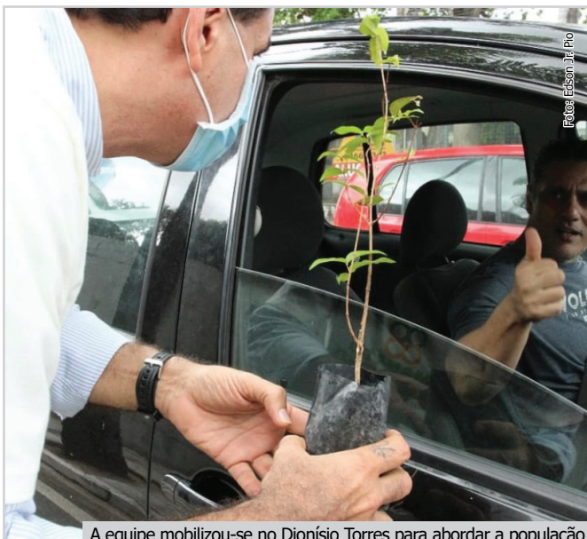
A equipe mobilizou-se no Dionísio Torres para abordar a população