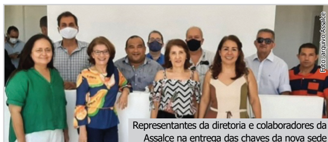
Representantes da diretoria e colaboradores da Assalce na entrega das chaves da nova sede