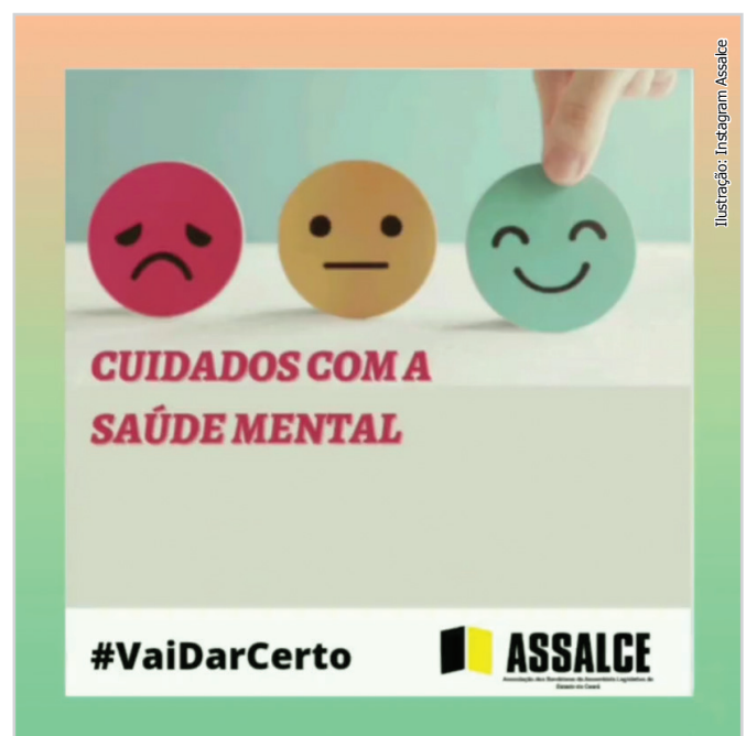
Ilustração: Instagram Assalce