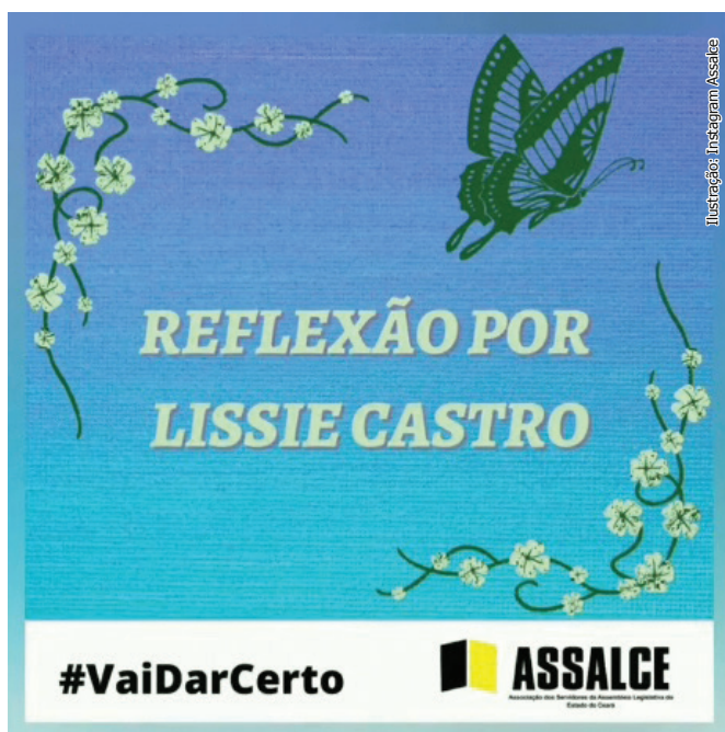
Ilustração: Instagram Assalce