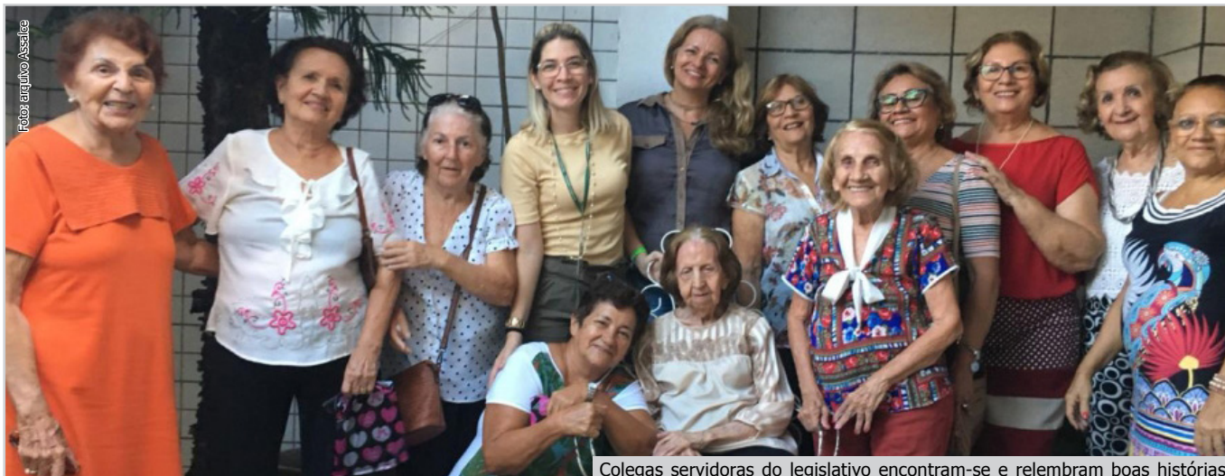
Colegas servidoras do legislativo encontram-se e relembram boas histórias

As visitas são realizadas, semanalmente, às quintas-feiras, pela manhã. Os interessados devem realizar o agendamento pelo telefone: (85) 3272-8832.